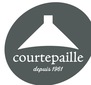
LOGO BLANC SUR FOND COULEUR FONCÉE