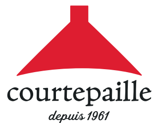
LOGO QUADRI TYPO NOIRE SUR FOND CLAIR